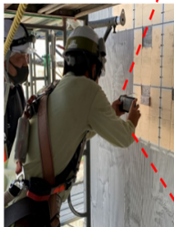
【スマホでタイル裏面を撮影】